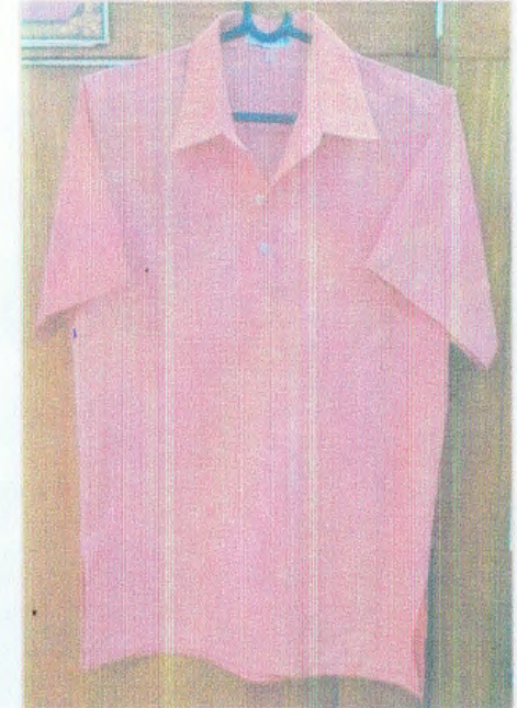
ชุดสูทบุรุษลำลอง แบบเสื้อโบลี