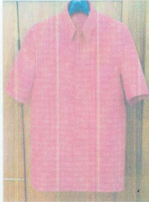
ชุดสูทบุรุษกึ่งทางการ แบบเสื้อซาฟารี