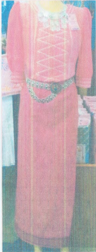
ชุดสุภาพสตรี ผ้าถุงมีเชิง